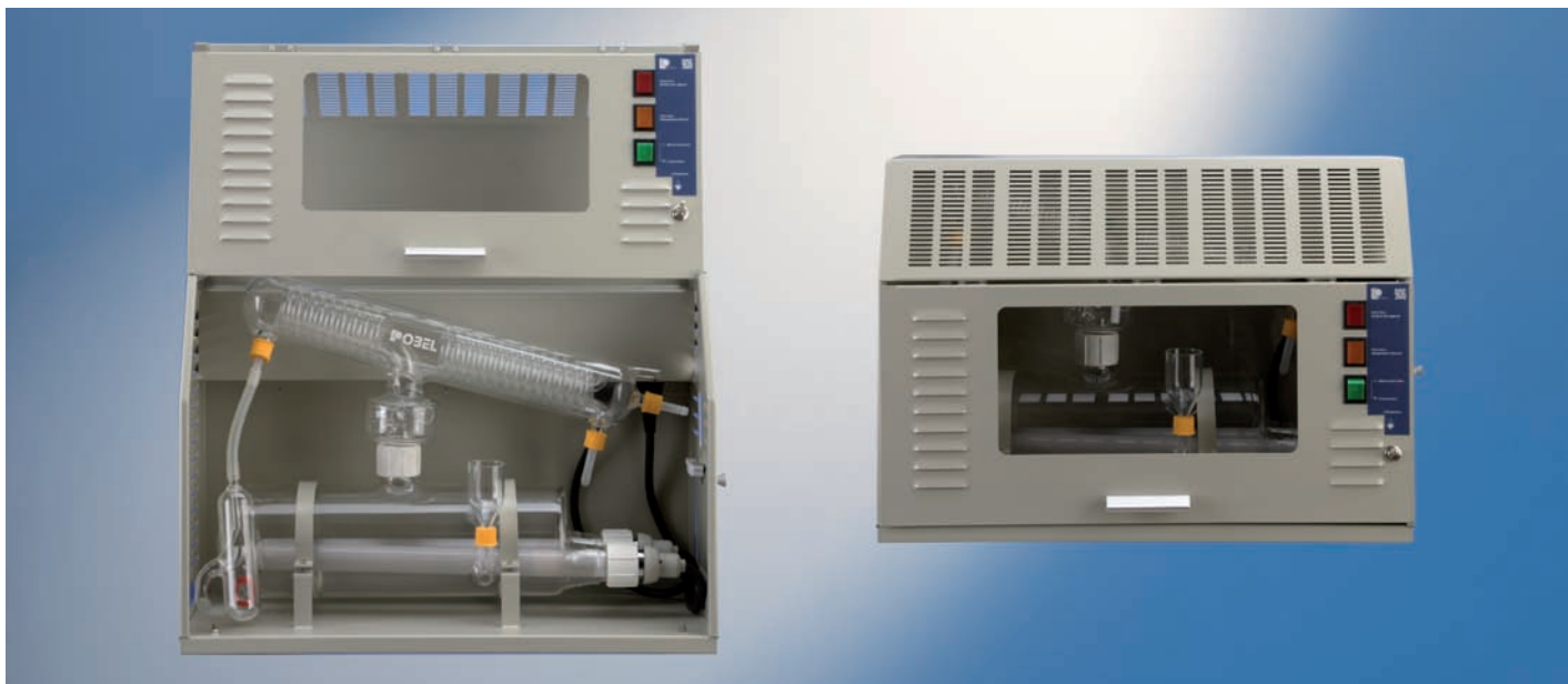
90 69 06

Producción: 6 - 7 litros/hora. Es un aparato que no precisa ningún tipo de atención en su funcionamiento por ser automático y de producción continua. Produce agua de alta pureza, exenta de iones metálicos y sustancias pirógenas. Provisto de varios sistemas de protección y seguridad: