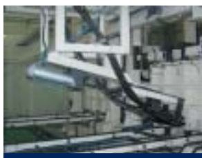
Proceso de inyección de la espuma de poliuretano de alta presión