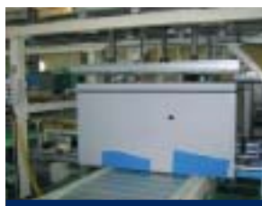
Instalación de la puerta