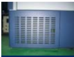
Los filtros son extraíbles y de fácil acceso a través de la puerta del condensador. Esto hace que la limpieza del filtro sea un trabajo fácil y cómodo.

El sistema está diseñado con la mente siempre puesta en el cliente