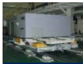
Preparación antes del proceso de inyección de la espuma aislante