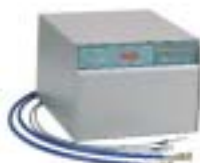
Back up de CO 2