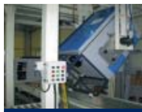
Anclaje de la carcasa de los compresores