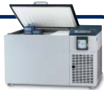
DF9010 (se muestra con el registrador de temperatura opcional)