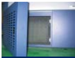
La cubierta de seguridad del condensador protege al usuario durante la limpieza del filtro.