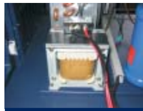
La Compensación Automática de Voltaje protege los componentes eléctricos