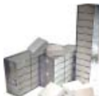
Racks de aluminio para almacenamiento