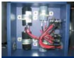
Los relés de arranque y los capacitadores minimizan la carga eléctrica y reducen el consumo eléctrico