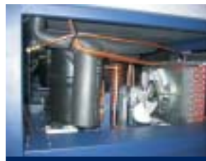
El condensador Tropicalizado de Gran Tamaño facilita el funcionamiento del sistema sin altas presiones de trabajo