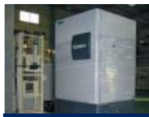
Embalaje del producto final