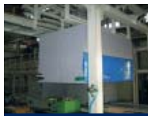
Instalación de la cabina interna en el mueble exterior