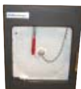
Registrador gráfico de 7 días